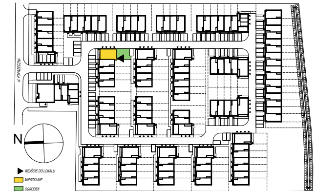
SCHEMAT PARTERU Z OGRÓDKAMI