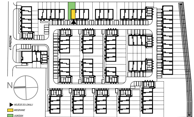
SCHEMAT PARTERU Z OGRÓDKAMI