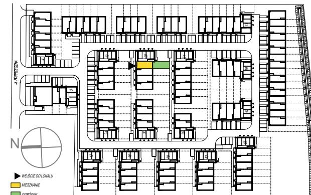
SCHEMAT PARTERU Z OGRÓDKAMI