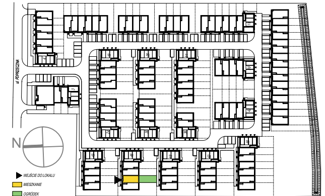
SCHEMAT PARTERU Z OGRÓDKAMI