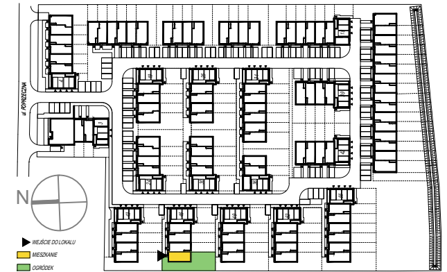
SCHEMAT PARTERU Z OGRÓDKAMI